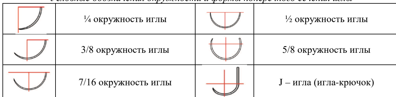
Условные обозначения окружности и формы поперечного сечения иглы